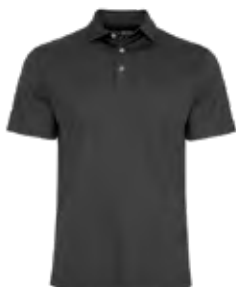
NOIR Black 6C

Les couleurs des tissus textiles sont sujettes aux variations du lot de teinture et ne correspondront pas exactement à la référence Pantone imprimée.