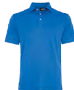
BLEU MAGNÉTIQUE 2945C

Les produits Callaway ne peuvent être vendus sans ornement.