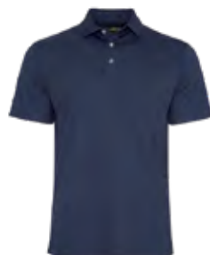
CABAN BLEU MARINE 289C