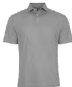
NUANCE DE GRIS 424C